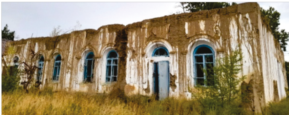
Рис. 8. Современное состояние здания бывшей таможни в Зайсане.

в Зайсане – ещё один свидетель эпохи географических открытий. В советское время в его стенах размещался краеведческий музей. Позднее этот дом перешёл в частную собственность: в данный момент со здания сняли крышу (разобрали старинную черепицу), и оно постепенно разрушается (рис. 8). Памятник истории и архитектуры, стены которого помнят известных исследователей Азии, погибает у всех на глазах.