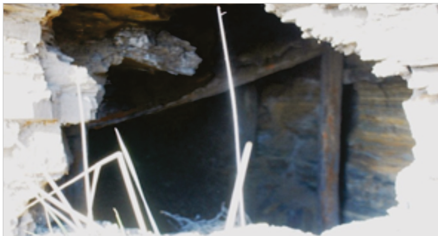
Рис. 5. Старая штольня на месте добычи каменного угля (Кендерлыкское месторождение).