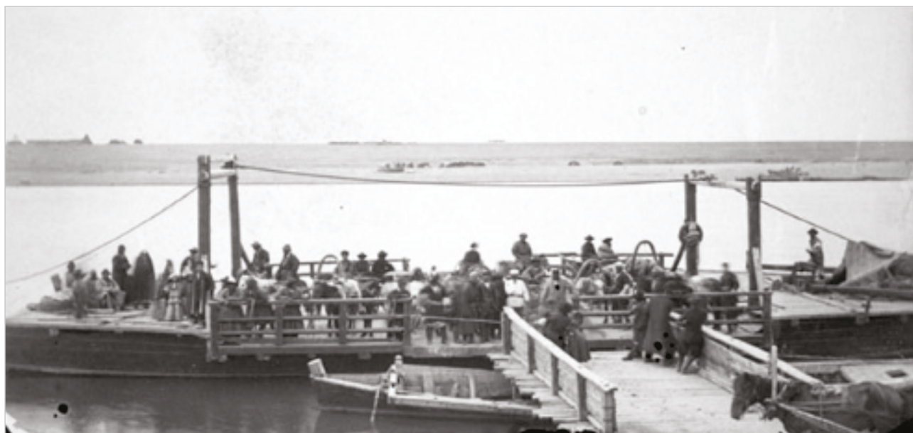
Иллюстрация №2. Семипалатинск. Паром на Иртыше.

Во время своего путешествия в Сибирь в 1885-1886 годах, дал описание парома и Джордж Кеннан – американский журналист, писатель и путешественник: «Выйдя из библиотеки, я направился в восточном направлении по берегу Иртыша и дошел до парома, который поддерживает сообщение между городом и киргизским предместьем, расположенным на противоположном берегу. Паром отходит с острова, лежащего по середине реки, и, чтобы попасть на него, приходится идти или по мосткам, или прямо через неглубокий рукав на стороне Семипалатинска» [4, с. 51].