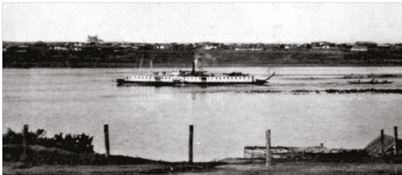
Иллюстрация №1. Вид на Заречную слободку, г. Семипалатинск.

В середине XIX века паромные переправы на верхнем Иртыше находились в четырех местах: в Усть-Каменогорске, Семипалатинске, при форпостах Шульбинском и Семиярском. Такое же количество было и пристаней: в Семипалатинске, в 3-х верстах выше Семипалатинска, при редутах Известковом и Вороньем.