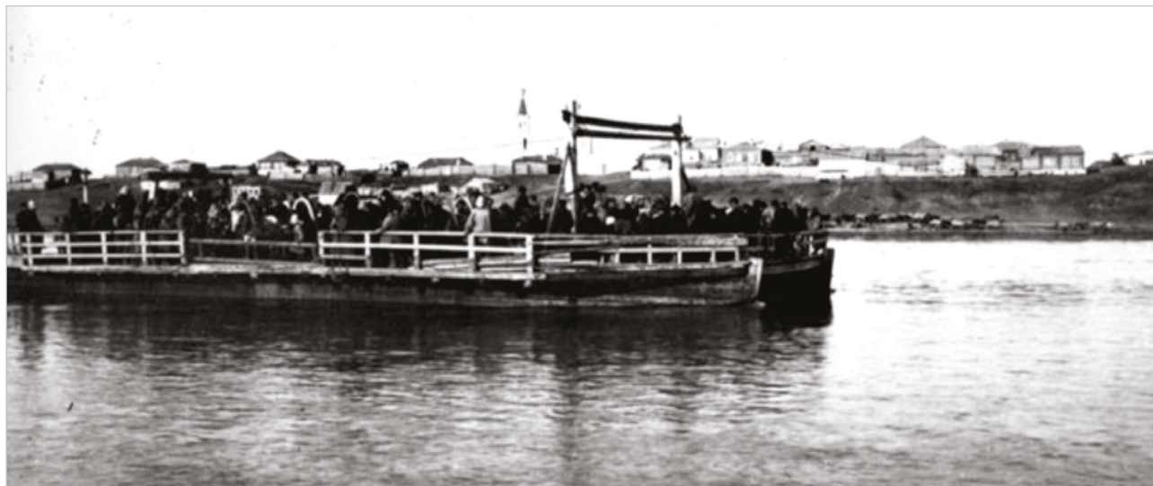
Иллюстрация №4. Перевозка людей по Иртышу, г. Семипалатинск.

1 апреля 1889 г. городскими властями была проверена готовность переправы к летнему периоду и было отмечено, что на реках Иртыш и Семипалатинка уже спущены на воду по одному парому, по два карбаса (карбасы – огромные плоскодонные просмоленные лодки, длиной 8-10 м и шириной 3-4 м, с небольшой осадкой даже в груженом виде. Когда не было паромов, они использовались также для перевозки через Иртыш крупного рогатого скота, лошадей, верблюдов, овец и др. тяжелых грузов) и по одной небольшой лодке, «которые по осмотру нашему оказались годными к употреблению и безопасными для переправы...».