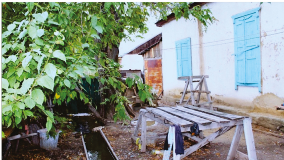
Рис. 6. Современное состояние бывшего дома А. С. Хахлова в Зайсане. Арык во дворе дома.

Зайсана) была обустроена пристань: укреплена дорога на песчаном участке, построены пакагуз и дома для конторы и пассажиров, а также налажена постоянная заготовка топлива для пароходов [8, л. 10].