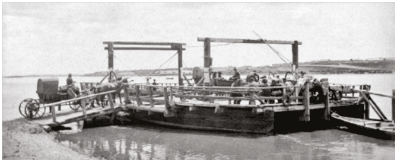
Иллюстрация №3. Паром-самолет на реке Иртыш, г. Семипалатинск.

– паром-самолет. К длинному канату, верхний конец которого опущен на середину реки с якорем, привязывались несколько лодок так, что они находились под острым углом к течению; вода напирала на них, и они постепенно заходили несколько вперед и под напором течения переплывали реку, увлекая и нижний конец каната, у которого привязан паром.